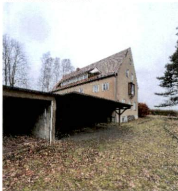
Carport und Garage