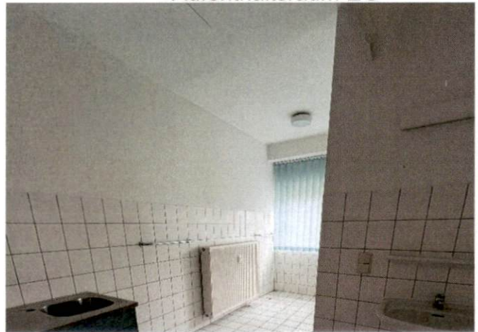
Waschraum im OG