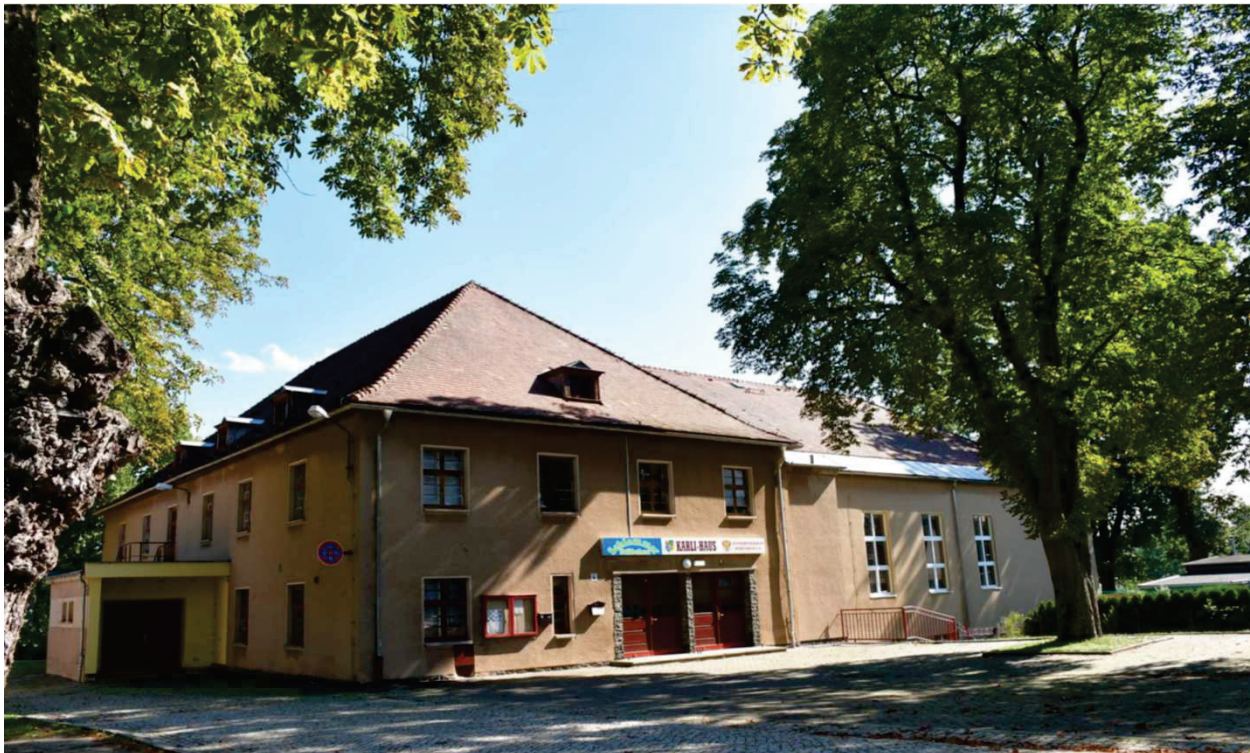
Ansicht von der Rosa- Luxemburg-Straße

Tel.: 03586/ 4515-0 * Fax: 03586/4515-45* E-Mail: info@seifhennersdorf.de