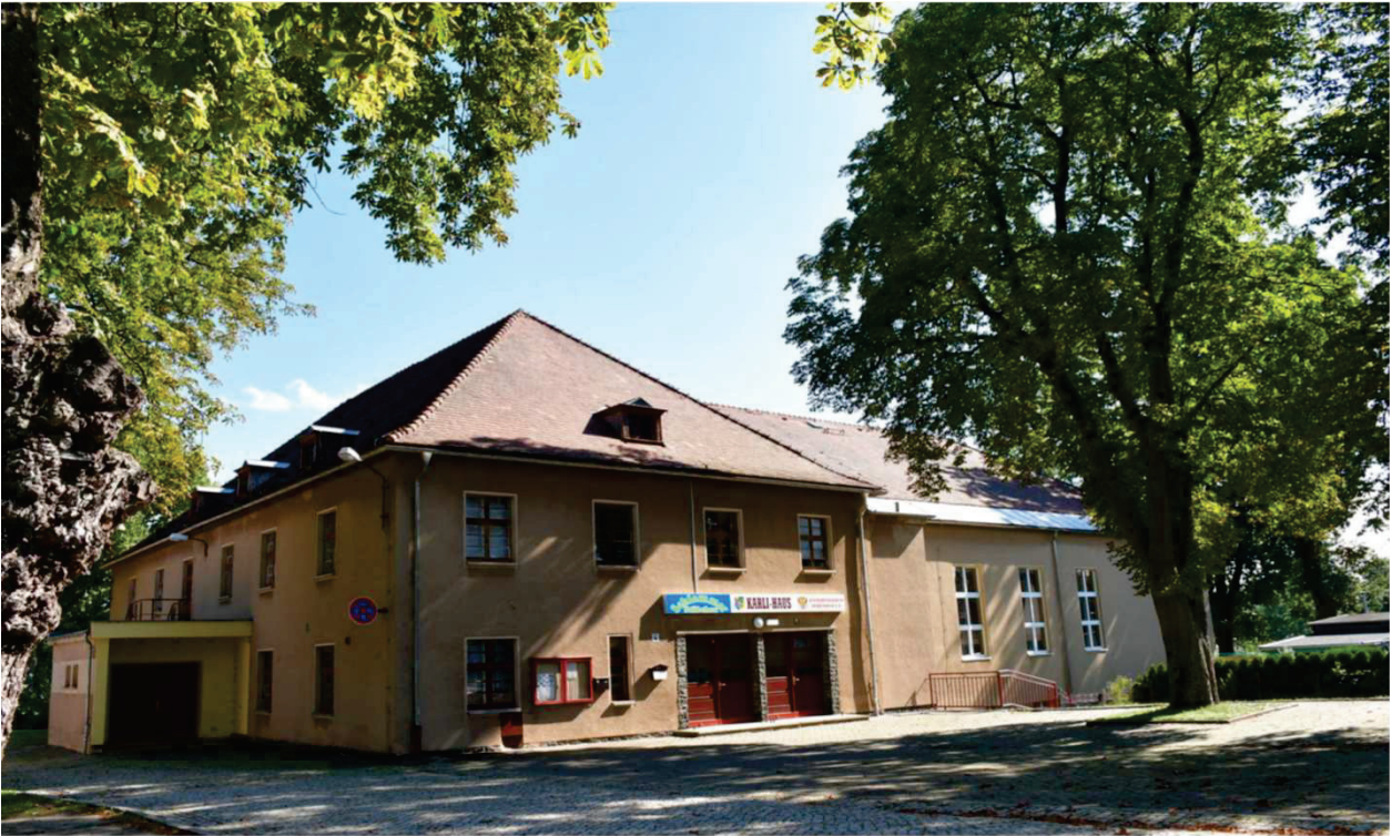
Ansicht von der Rosa- Luxemburg-Straße

Besichtigung und Einsicht des Gutachtens nach Vereinbarung möglich: Tel.: 03586/ 4515-0 * Fax: 03586/4515-45* E-Mail: info@seifhennersdorf.de